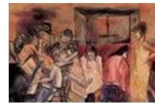
Personnages et Paysages Mexicains – Curitiba, 2002