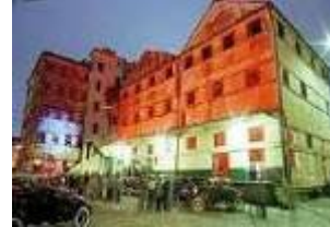
Capitale Américaine de la Culture - Curitiba, 2003