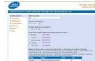
Gestion de l'appel à projets 2007 de l'Institut Caixa Cultural Brésil, 2007