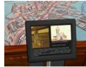
Musée Paulista (Ipiranga) São Paulo, 2007