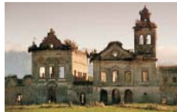
Centre d'expositions du Comperj (Petrobras) Itaboraí, Etat de Rio de Janeiro, RJ