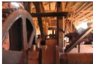
Projet de Musée de la Canne à Sucre – Moulin à Sucre Central, Sertãozinho, SP