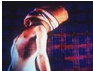
Exposition Imagétique Curitiba, 2002