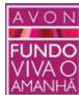
Fonds Avon Vive l'Avenir Brésil