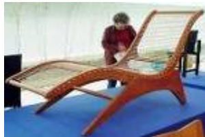
Una Historia del Sentarse - Curitiba, 2002