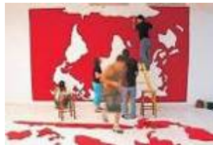
Panorama del Arte Paranaense Curitiba, 2002