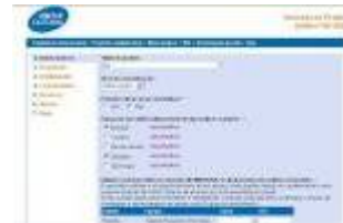
Gestión de la convocatoria 2007 Caixa Cultural – Brasil, 2007