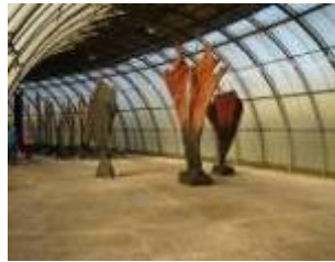
Espacio Cultural Frans Krajcberg – Arte y Medio Ambiente – Curitiba, 2003