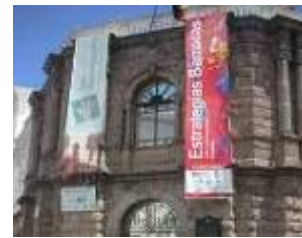
Estrategias Barrocas – Arte Contemporáneo Brasileño Quito, Ecuador, 2004