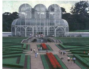
Innovación y Solidaridad – Curitiba, 2002