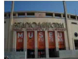
Proyecto del Museo del Fútbol – Sala de ciencias São Paulo, SP