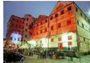
Capital Americana de la Cultura Curitiba, 2003