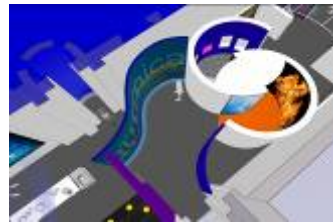
Proyecto del Museo del Niño, Sala de Química – São Paulo, SP