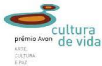
Premio Avon Cultura de Vida – Brasil