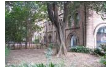
Proyecto del Museo da TV Brasileira– São Paulo, SP