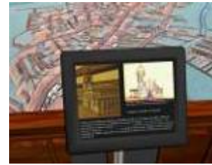
Museo Paulista (Ipiranga) – São Paulo, 2007