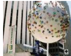
Árbol Show – São Paulo, 2005