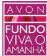
Fondo Avon Viva el Mañana - Brasil