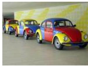
Exposición Materia Prima Curitiba, 2002