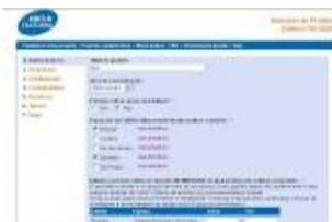
Gerenciamento Edital 2007 Caixa Cultural – Brasil, 2007