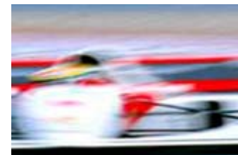
Projeto do Museu da Velocidade – Brasília, DF