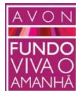
Fundo Avon Viva o Amanhã - Brasil