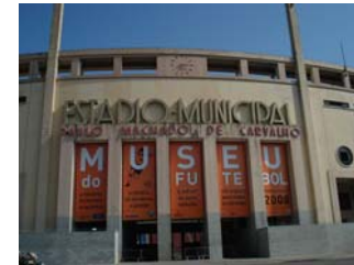
Projeto do Museu do Futebol – Sala Ciências - São Paulo, SP