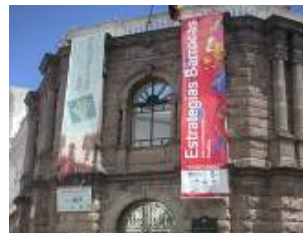
Estratégias Barrocas – Arte Contemporânea Brasileira Quito, Equador, 2004