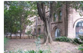
Projeto do Museu da TV Brasileira– São Paulo, SP