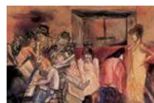
Personagens e Paisagens Mexicanas – Curitiba, 2002