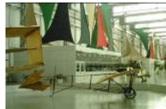
Projeto museográfico do Museu Asas de um Sonho – São Carlos, SP