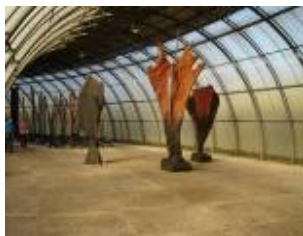
Espaço Cultural Frans Krajcberg – Arte e Meio Ambiente – Curitiba, 2003