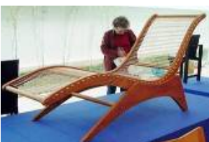
Uma História do Sentar - Curitiba, 2002