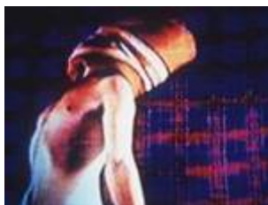
Exposição Imagética Curitiba, 2003