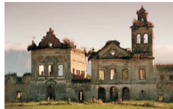
Centro expositivo do Comperj (Petrobras) - Itaboraí, RJ