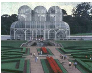
Inovação e Solidariedade – Curitiba, 2002