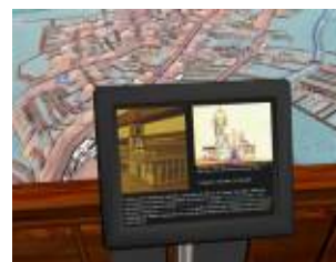
Museu Paulista (Ipiranga) – São Paulo, 2007