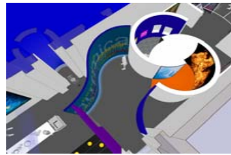
Projeto do Museu da Criança, Sala de Química – São Paulo, SP