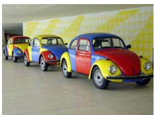
Matéria Prima Curitiba, 2002