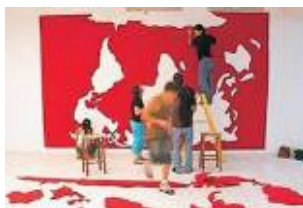
Panorama da Arte Paranaense Curitiba, 2002