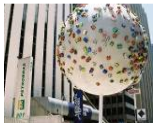
Árvore Show – São Paulo, 2005 e Curitiba, 2007