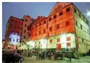
Capital Americana da Cultura Curitiba, 2003